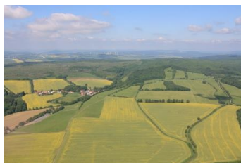
Wildkatzendorf Hütscheroda: vorne Felder – hinten Nationalpark