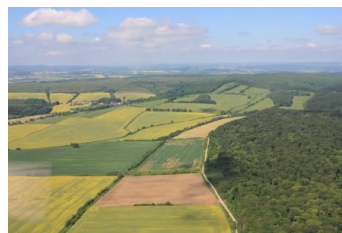
Behringer Holz: links Felder – rechts Nationalpark