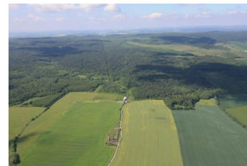
Fuchsfarm: vorne Felder – hinten Nationalpark