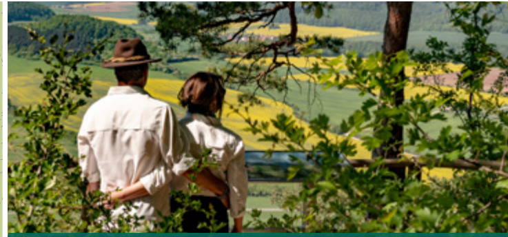
Kulturdenkmäler und Aussichtspunkte laden ein, zum Verweilen und Rasten.