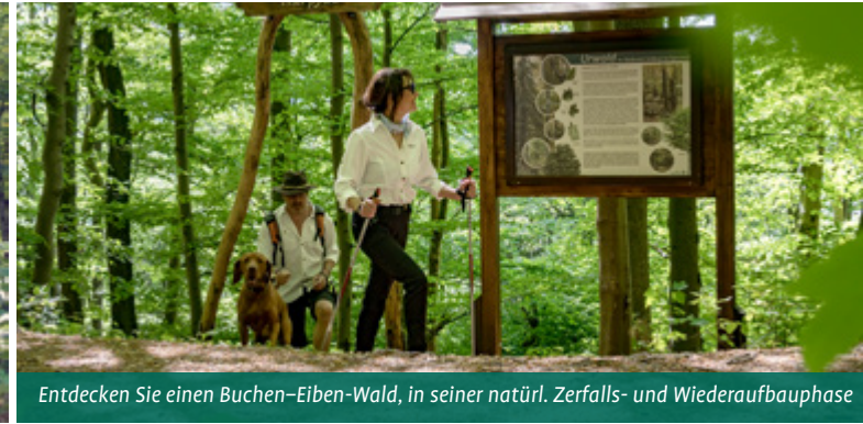
Entdecken Sie einen Buchen-Eiben-Wald, in seiner natürl. Zerfalls- und Wiederaufbauphase