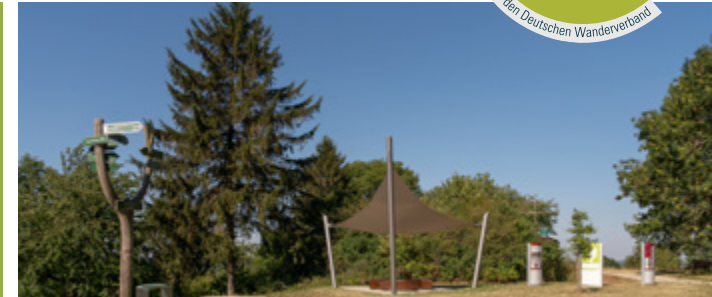
Der Wartberg bietet einen wunderbaren Panoramablick über das Eichsfeld.