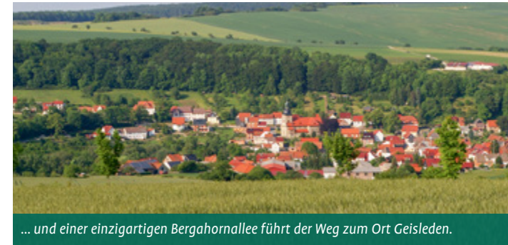
... und einer einzigartigen Bergahornallee führt der Weg zum Ort Geisleden.