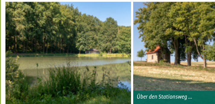
Über den Stationsweg ...