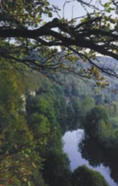
Werra bei Probstzella