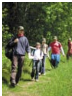
Die Natur kennen lernen

Der Naturpark Eichsfeld-Hainich-Werratal bietet Wanderfreunden mit dem Naturparkwanderweg etwas ganz besonderes an. Der Weg führt Sie von Heilbad Heiligenstadt durch die verschiedenen Regionen des Naturparks bis nach Creuzburg. Auf einer Gesamtstrecke von 105 km können Sie auf Entdeckungsreise zwischen Leine und Werra gehen und neben Natur und Kultur auch die Menschen der Region kennen lernen.