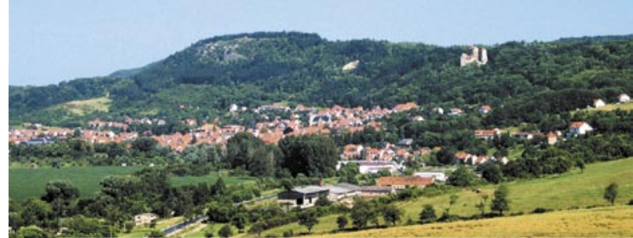
Blick auf Treffurt mit Burg Normannstein